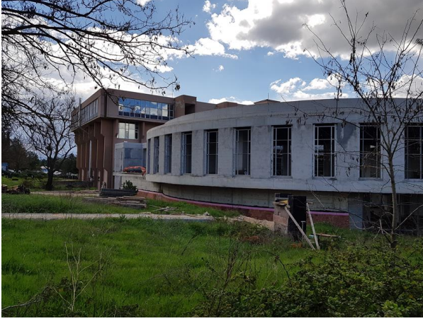
Kütüphane Ek Hizmet Binası