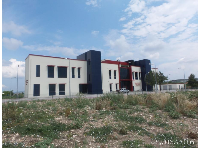
Merkezi Araştırma Laboratuvarı