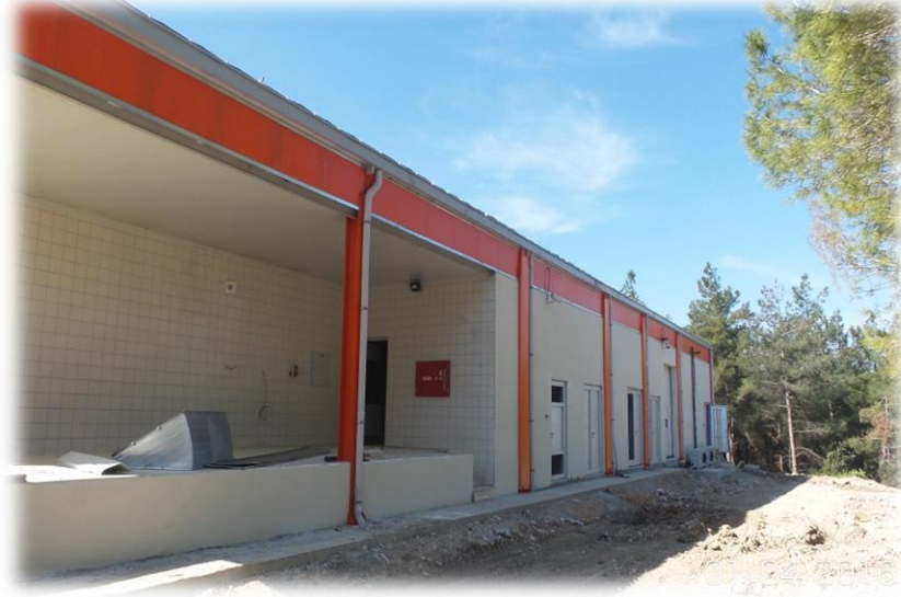
Veteriner Fakültesi Et Süt Ünitesi