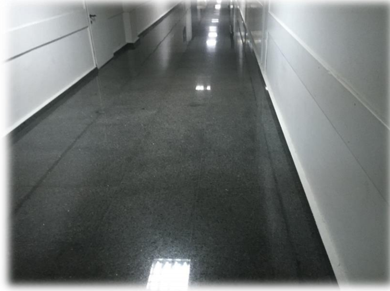
Hastane Granit Kaplama İşine Ait Bir Fotoğraf